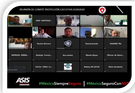
Reunión Virtual de Comité Protección Ejecutiva 01 de abril del 2020 Asistentes:16