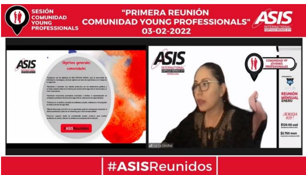
Sesión de la Comunidad Young Professionals 3 de febrero 2022 Asistentes: 12