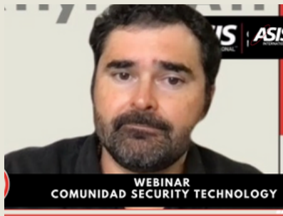
Webinar de la Comunidad Security Technology 24 de febrero 2025 Asistentes: 33