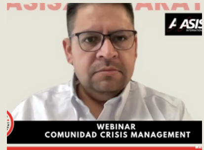
Webinar de la Comunidad Crisis Management 27 de febrero 2025 Asistentes: 41