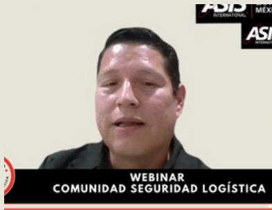
Webinar de la Comunidad Seguridad Logística 24 de febrero 2025 Asistentes: 21