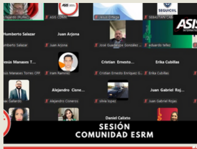
Sesión de la Comunidad ESRM 27 de febrero 2025 Asistentes: 67