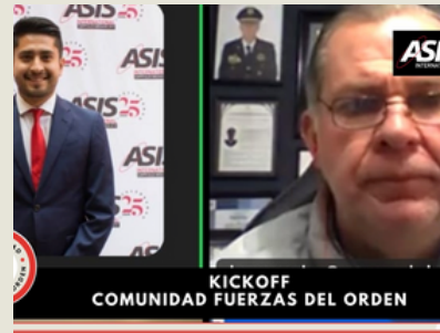
Plática en conjunto de las Comunidades WIS y NextGen 28 de febrero 2025 Asistentes: 40