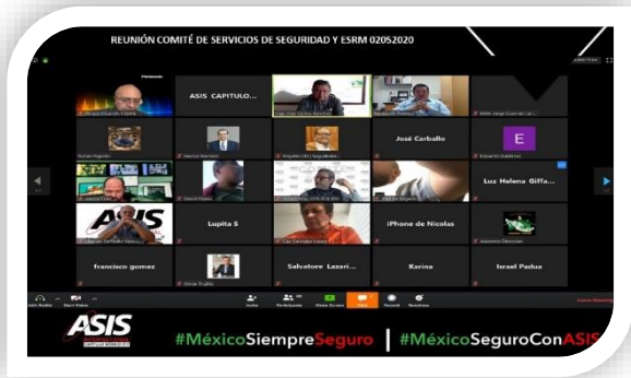
Reunión Virtual comité Servicios de Seguridad y ESRM "Indicadores de gestión de seguridad" 02 de mayo del 2020 Asistentes: