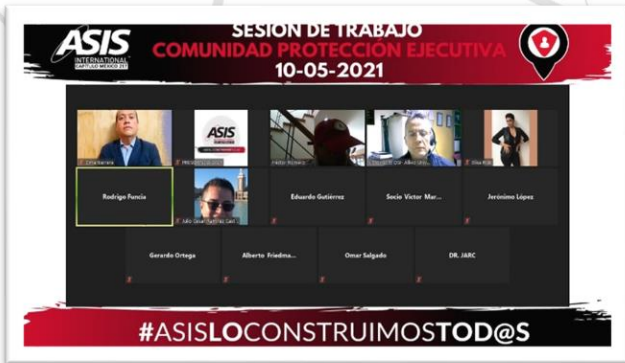
Sesión de Trabajo Comunidad de Protección Ejecutiva 10 de mayo 2021 Asistentes: 13