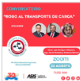
Conversatorio de la Comunidad Cadena Logística