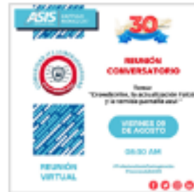
Conversatorio de la Comunidad ITS