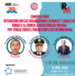
Reunión Mensual de Agosto