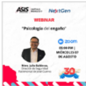
Webinar de la Comunidad Nextgen