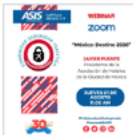
Webinar de la Comunidad Seguridad Turística