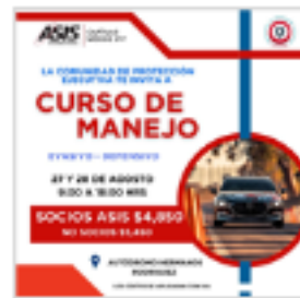
Curso de Manejo Evasivo Defensivo