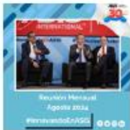
Reunión Mensual Agosto