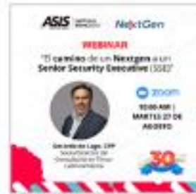
Webinar de la Comunidad Nextgen