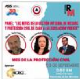
Reunión Mensual Septiembre