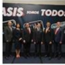
Reunión Mensual Enero 2020