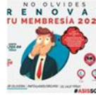
Renueva tu membresía ¡es muy fácil!