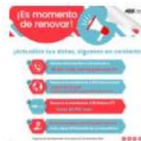
¡Es momento de renovar!