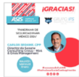
Gracias por ASIStir a nuestra Reunión Mensual de enero 2024