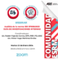
Webinar de las Comunidades ESRM e Investigaciones e Inteligencia