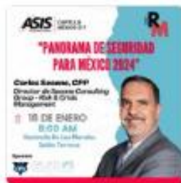
Reunión Mensual Enero 2024