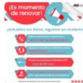
¡Es momento de renovar!