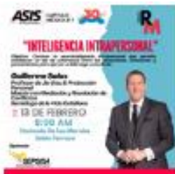
Reunión Mensual Febrero