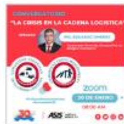
Conversatorio en conjunto de las Comunidades Crisis Management y Cadena Logística