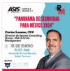
Reunión Mensual Enero 2024