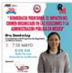
Reunión Mensual Mayo