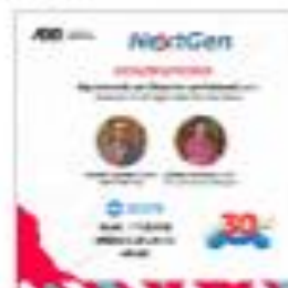
Conversatorio de la Comunidad Nextgen