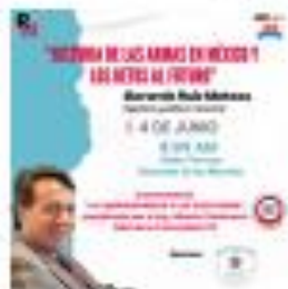
Reunión Mensual Junio