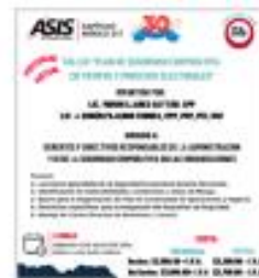
Taller "Plan de Seguridad Corporativa en Tiempos y Procesos Electorales"