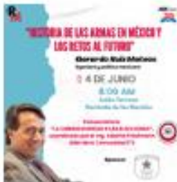
Reunión Mensual Junio