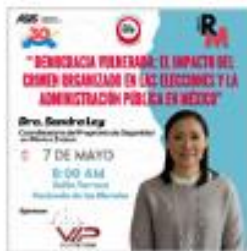
Reunión Mensual Mayo