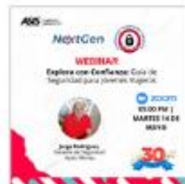
Webinar de la Comunidad Nextgen en conjunto con la Comunidad Seguridad Turística