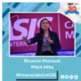
Reunión Mensual Mayo