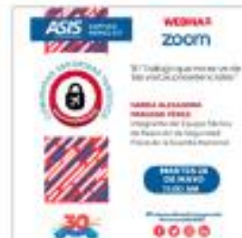
Webinar de la Comunidad Seguridad Turística