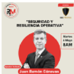
REUNIÓN MENSUAL MAYO