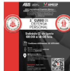
2ª edición del Curso de Defensa Personal