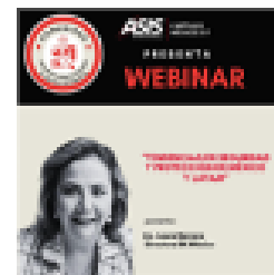
Webinar Comunidad Investigaciones e Inteligencia