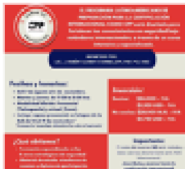
Prepárate para convertirte en CPP