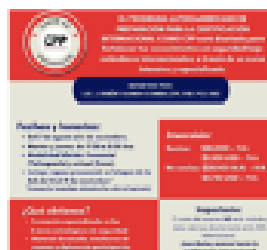
Prepárate para convertirte en CPP