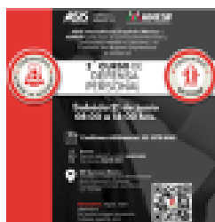
2ª edición del Curso de Defensa Personal