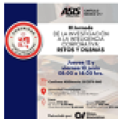
III Jornada "De la Investigación a la Inteligencia Corporativa"