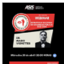
Webinar Comunidad Fuerzas del Orden