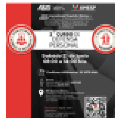
2ª edición del Curso de Defensa Personal